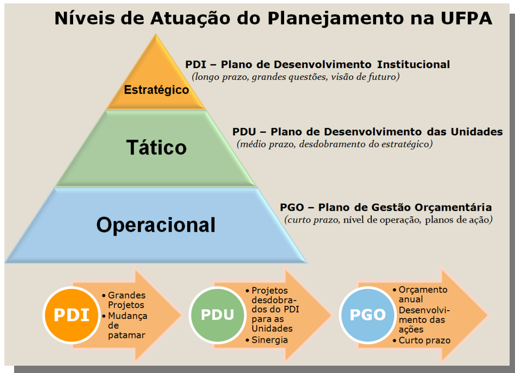
Gráfico 01: Níveis de atuação do planejamento na UFPA

O Plano de Desenvolvimento do Núcleo de Pesquisas em Oncologia - NPO trata do desdobramento da estratégia da Universidade através de um planejamento tático, traduzindo os objetivos gerais e as estratégias da alta administração em objetivos e metas mais específicas e claras para as Unidades. (Ver Gráfico 01)