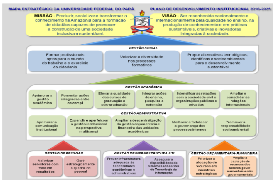
Figura 3: Mapa Estratégico da UFPA

O Planejamento Tático é concebido em cada unidade que compõe a Universidade Federal do Pará. Ele enfatiza as atividades correntes de cada subunidade estabelecendo uma visão em médio prazo de como essas atividades podem ser melhoradas continuamente buscando atingir os objetivos estratégicos da Instituição. Figurando esses objetivos, logo abaixo está o mapa estratégico da UFPA: