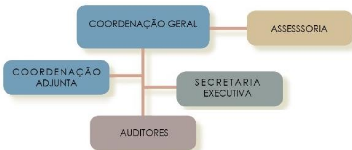
Figura 1 – Organograma da Auditoria Interna